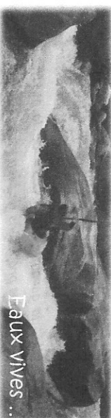
Eaux vives ...