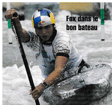
Fox dans le bon bateau